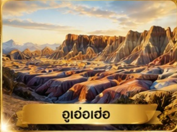
อู่อ้อเฮ่อ