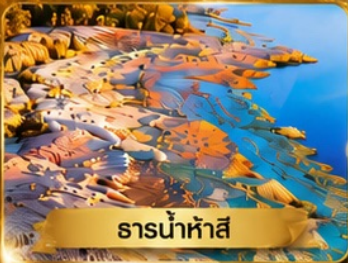
ธารน้ำห่าสี