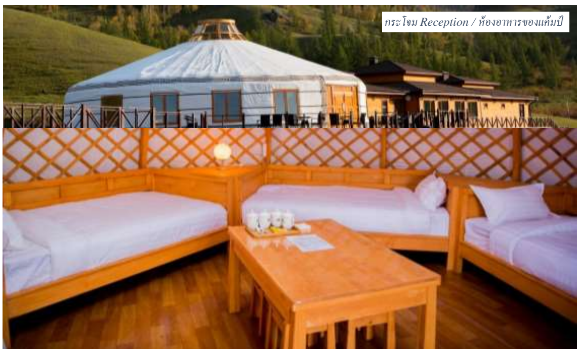
กระจงมิก Reception / ห้องอาหารของแคมป์

พักที่ GER กระจงมิกท่องเที่ยว TERELJ STAR RESORT หรือระดับเดียวกัน