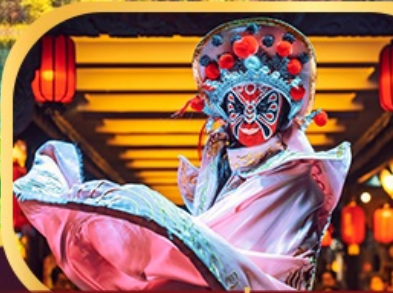
การแสดงเปลี่ยนหน้ากาก