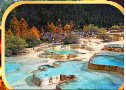
อุทยานหวงหลงมรดกโลก