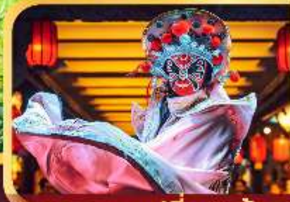
การแสดงเปลี่ยนหน้ากาก

WCN160611 6 วัน 5 คืน 3U บิน SICHUAN AIRLINES