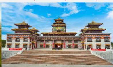
ทำเนียบพระลามะอุหลาน