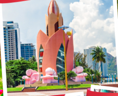
Nha Trang Cathedral