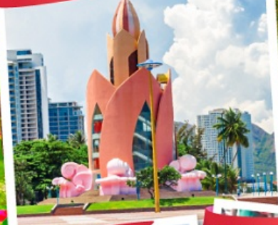
Nha Trang Cathedral