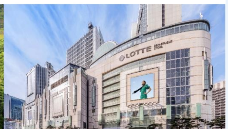
Lotte Center Hanoi

*ทางบริษัทฯ ขอสงวนสิทธิ์ในการสลับโปรแกรมทัวร์ตามความเหมาะสมขึ้นอยู่กับสถานการณ์หน้างาน โดยคำนึงถึงผลประโยชน์ของลูกค้าเป็นสำคัญ