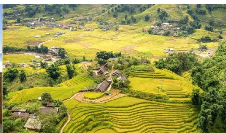
หมู่บ้านท่าฟาน