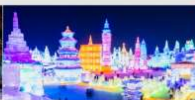
เทศกาลคอมไฟน้ำแข็ง