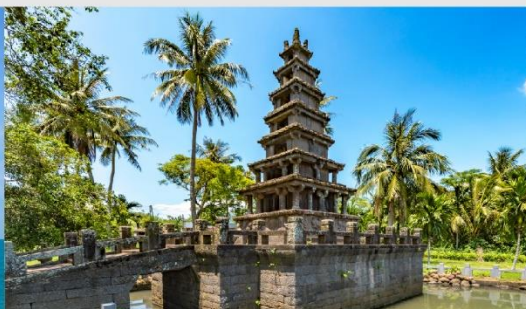
เจดีย์ 2 พี่น้องเหม่ยหลาน