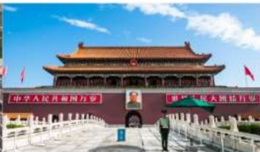
พระราชวังต้องห้ามปักกิ่ง