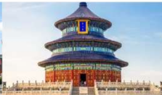
หอสังเกตการณ์ฟ้าเทียนถาน

*ทางบริษัทฯ ขอสงวนสิทธิ์ในการปรับเปลี่ยนโปรแกรมทัวร์ตามความเหมาะสมขึ้นอยู่กับสถานการณ์หน้างาน โดยคำนึงถึงผลประโยชน์ของลูกค้าเป็นสำคัญ