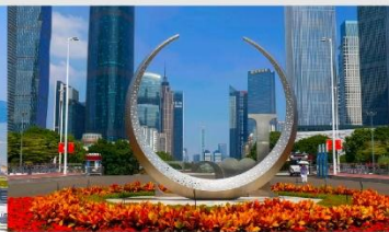
จัตุรัสฮัวเจิง

*ทางบริษัทฯ ขอสงวนสิทธิ์ในการสลับโปรแกรมทัวร์ตามความเหมาะสมขึ้นอยู่กับสถานการณ์หน้างาน โดยคำนึงถึงผลประโยชน์ของลูกค้าเป็นสำคัญ