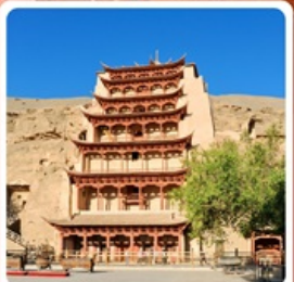
กำแพงเกาหลู