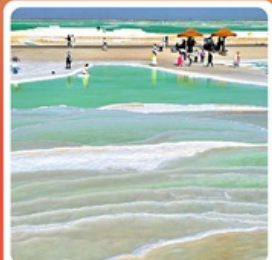
ทะเลสาบเกลือดาเอ้อหนาน