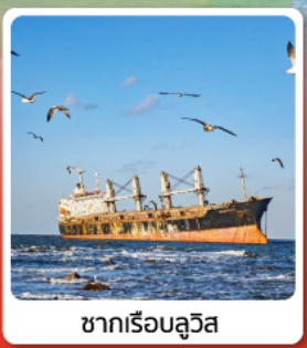
ซากเรือลู่วิส