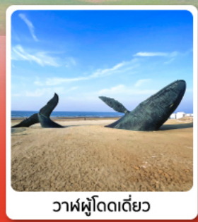
วาฬฟู่โถดเดี่ยว