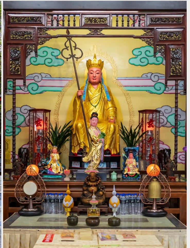
วัดพระถังซัมจั๋ง (Xuanguang Temple)

นำท่านเดินทางสู่ กรุงไทเป (TAIPEI CITY) เมืองหลวงของไต้หวัน ศูนย์กลางทางการเมือง การปกครอง เศรษฐกิจ การค้า และวัฒนธรรมที่หลากหลาย มีประชากรประมาณ 2.6 ล้านคน กรุงไทเปถูกสร้างขึ้นตั้งแต่ปลายศตวรรษที่ 19 สมัยราชวงศ์ชิง มีอายุกว่า 130 ปีมาแล้ว แต่ยังคงรักษาไว้ซึ่งวัฒนธรรมอันเก่าแก่ อย่างเช่น โบราณสถาน ถนนสายเก่า และวัดวาอาราม ที่มีคุณค่าทางประวัติศาสตร์อยู่มากมาย ปัจจุบันไทเปเป็นหนึ่งในเมืองขนาดใหญ่ในทวีปเอเชียที่มีย่านการค้าที่มีชื่อเสียง มีอาหารนานาชาติ บรรยากาศยามค่ำคืนที่คึกคัก และระบบคมนาคมขนส่งสาธารณะที่มีประสิทธิภาพ รวมถึงเป็นที่ตั้งของตึก Taipei 101 ซึ่งเคยเป็นตึกที่สูงที่สุดในโลก และมีสถานที่ท่องเที่ยว ทั้งทางธรรมชาติและวัฒนธรรมอีกมากมาย (ใช้เวลาเดินทางประมาณ 3 ชั่วโมง 30 นาที)