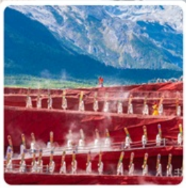
Impressions of Lijiang