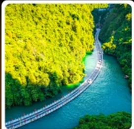
คุบเขาสิงโต