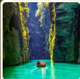
ผิงซานแกรนด์แคนยอน