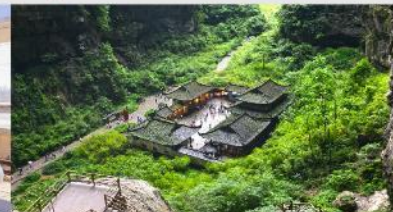
อุทยานแห่งชาติบ่อหลุมฟ้า

*ทางบริษัทฯ ขอสงวนสิทธิ์ในการสลับโปรแกรมทัวร์ตามความเหมาะสมขึ้นอยู่กับสถานการณ์หน้างาน โดยคำนึงถึงผลประโยชน์ของลูกค้าเป็นสำคัญ