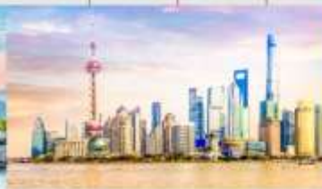
หาดไว่ถาน