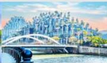
เทียนอันเหมินชู้