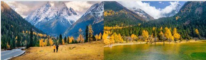
ภูเขาสี่ดรุณี (หุบเขาชวงเจียวโกว)