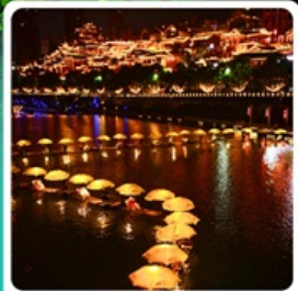
เมืองเซียนเอิน