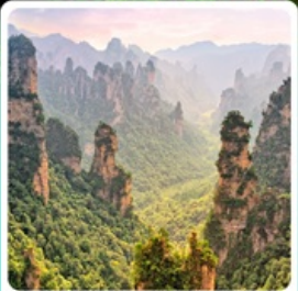
เซาอวตาร