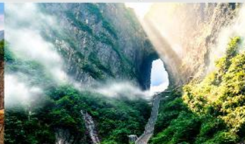
ประตูลัทธิ