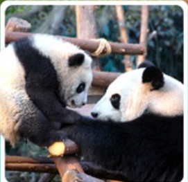
หุบเขาแพนด้าตู่เจียงเอี้ยน