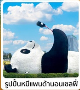
รูปปั้นหมีแพนด้าอนุเชลฟ์