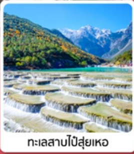
ทะเลสาบไป๋ส่วยเหอ