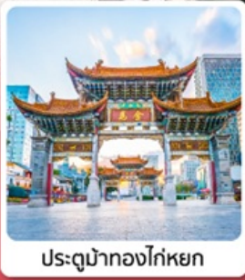
ประตูมำกวงโก๋หยก