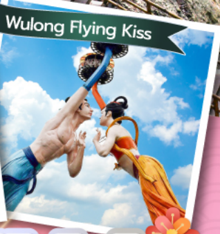
Wulong Flying Kiss