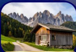
อุทยานฯ โดโลไมท์