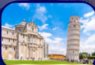
หอเอนแห่งเมืองปิซ่า