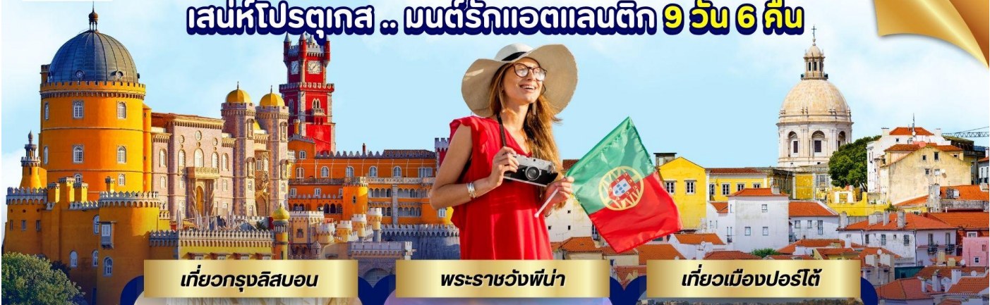
เที่ยวกรุงลิสบอน