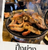
ปิ้งย่าง