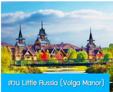
สวน Little Russia (Volga Manor)

หลังอาหารนำท่านเดินทางสู่ เมืองฮาร์บิน 哈尔滨市 (ระยะทาง 250 กม.ใช้เวลาเดินทางราว 3 ชั่วโมงเศษ) เมืองฮาร์บินเป็นเมืองที่ตั้งอยู่ทางตอนเหนือของจีนที่มีพรมแดนติดกับประเทศรัสเซีย เป็นเมืองเอกของมณฑลเฮยหลงเจียง มีสมญานามว่าเป็นกรุงมอสโกตะวันออก และได้ชื่อว่าเป็นเมืองหลวงแห่งฤดูหนาวเนื่องจากเมืองแห่งนี้มีช่วงฤดูหนาวยาวกว่าฤดูร้อน มีเทศกาลแกะสลักน้ำแข็งนานาชาติจัดขึ้นที่เมืองนี้ในช่วงฤดูหนาวของทุกปี เป็นจุดหมายปลายทางสำหรับนักท่องเที่ยวทั้งในและต่างประเทศที่ชื่นชอบความสวยงามของหิมะในฤดูหนาว