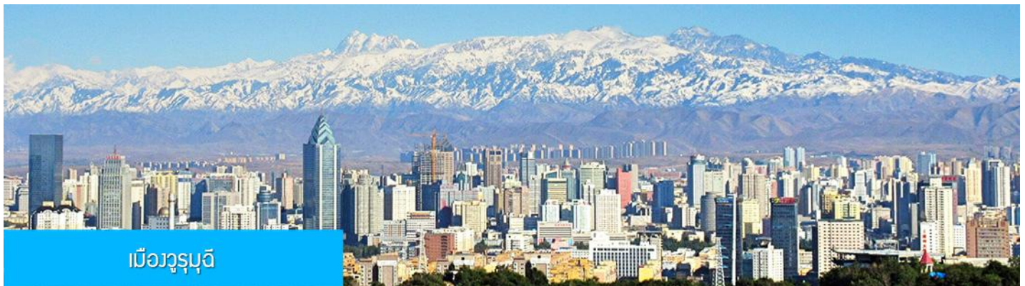
เมืองอูรูมูฉี

พักที่ MERCURE HOTEL โรงแรมระดับ 4 ดาวท้องถิ่นหรือเทียบเท่าในเมืองอูรูมูฉี