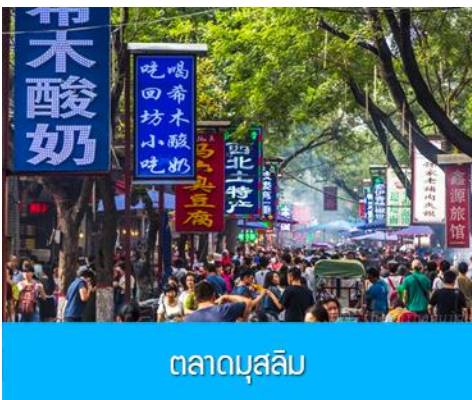
ตลาดมุสลิม