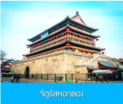
จัตุรัสหอกลอง