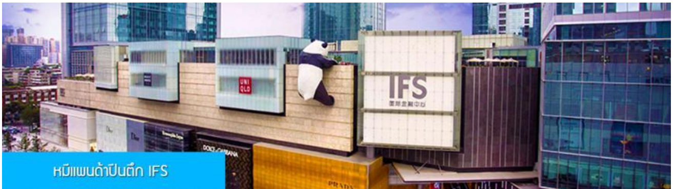
หมีแพนด้าปีนตึก IFS