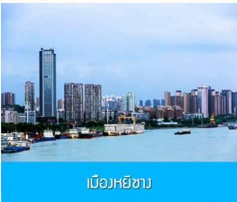
เมืองหยีซัง