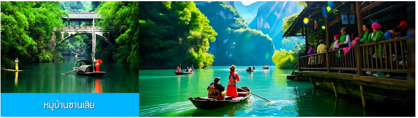
หมู่บ้านซานเสี๋ย