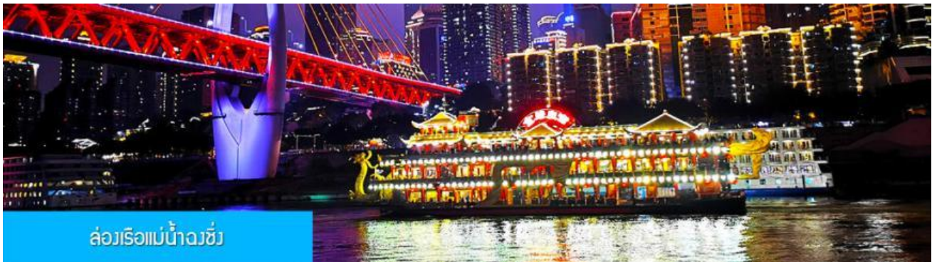
ล่องเรือแม่น้ำฉงชิ่ง