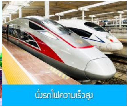
บ่รกดไฟควมเร็วสุ