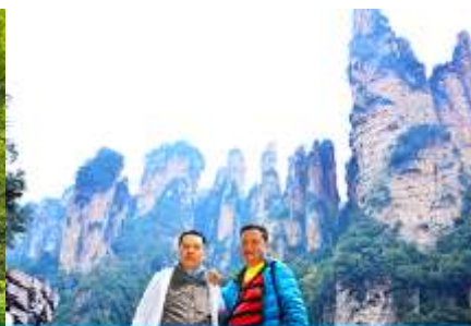
ชมจุดชมวิวลีฟท์แก้ว

วันที่ห้า เมืองจางเจี๋ยเจี๋ย – เลือกซื้อโปรแกรมทัวร์เสริมออฟชั่น อุทยานอวตารจุดชมวิวจินเปียนซี-ชมจุดชมวิวลีฟท์แก้ว - ร้านหยก-ร้านใบชา-เดินทางกลับเมืองหยี่ซัง