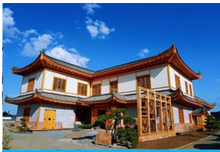
หมู่บ้านวัฒนธรรมเกาหลี

จากนั้นนำท่านเดินทางสู่เมืองตุนฮว่า 敦化 (ระยะทาง 130 กม. ใช้เวลาเดินทางราว 2 ชั่วโมง)