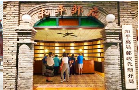
เมืองโบราณจำลอง