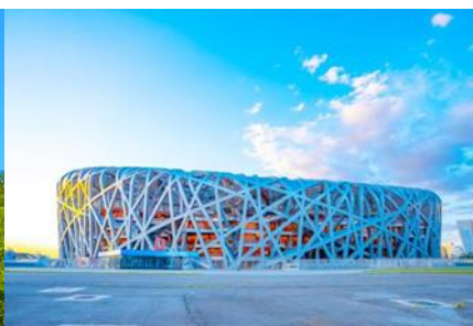
สนามกีฬาโอลิมปิก