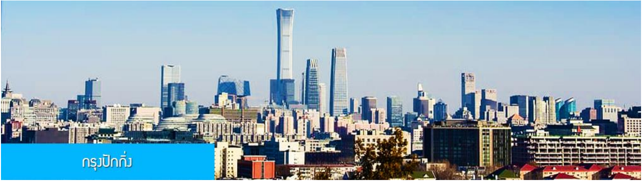
กรุงปักกิ่ง