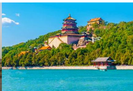
พระราชวังฤดูร้อนหยี่เหอหยวน