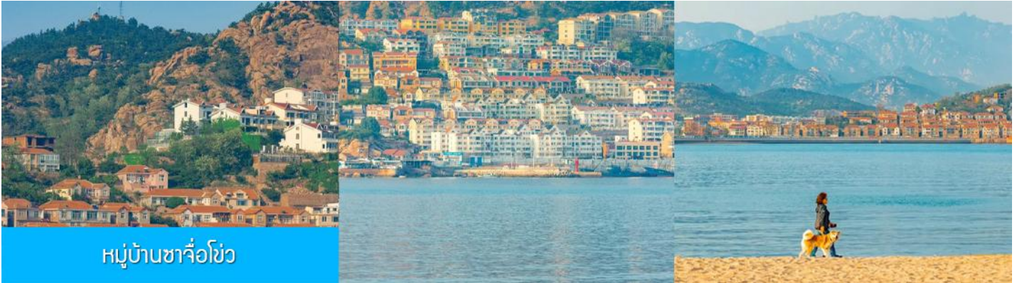
หมู่บ้านซาจื่อโจว

เช้า รับประทานอาหารเช้า ณ ห้องอาหารของโรงแรม (4)