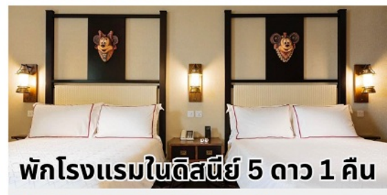
พักโรงแรมในดิสนีย์ 5 ดาว 1 คืน