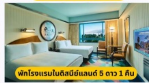
พักโรงแรมในดิสนีย์แลนด์ 5 ดาว 1 คืน