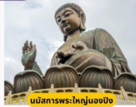
นมัสการพระใหญ่ของปิง