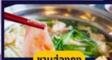
ชาบูฮ่องกง