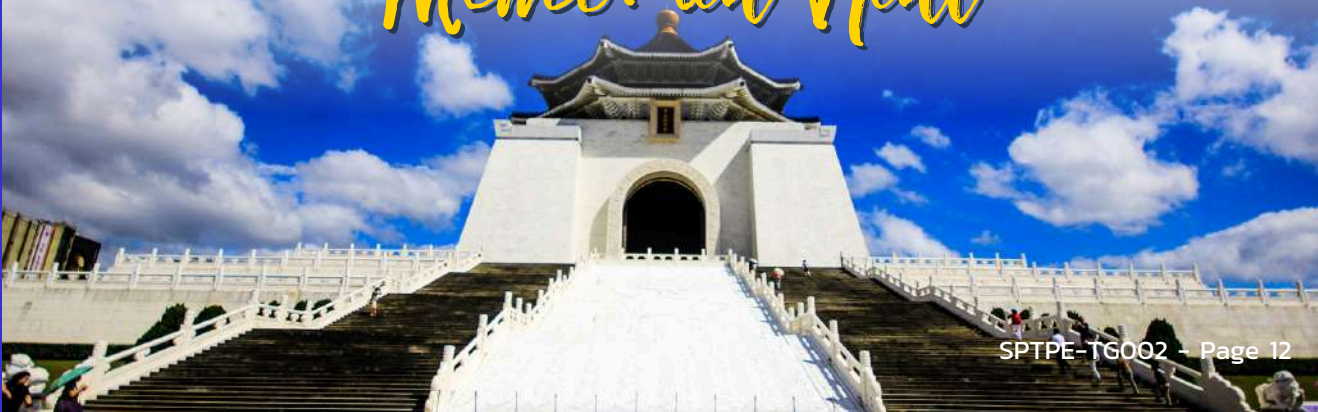
National Chiang Kai-Shek Memorial Hall

นำท่านเดินทางสู่ อนุสรณ์สถานเจียงไคเชก ตั้งอยู่ตรงใจกลางของเมืองไทเปที่มีพื้นที่ 2,500 ตารางกิโลเมตรแห่งนี้ถูกตกแต่งและประดับเป็นอย่างดี โดยตัวอาคารของอนุสรณ์สถานถูกสร้างขึ้นตามแบบสถาปัตยกรรมจีนโบราณ บันไดทั้งสี่ด้านถูกสร้างด้วยหินอ่อนสีขาวเป็นขั้นตามแบบพระมิดอียิปต์ หลังคาสีน้ำเงิน รวมทั้งยังมีสวนดอกไม้สีแดง ที่เป็นการแสดงออกทางสัญลักษณ์ให้เห็นถึงอิสรภาพ ความเท่าเทียม และความเป็นหนึ่งเดียวกัน ตามสีของธงชาติไต้หวัน สถานที่แห่งนี้นอกจากจะเป็นแลนด์มาร์คอันสำคัญของไทเปที่มีนักท่องเที่ยวมาเยี่ยมชมอย่างไม่ขาดสายแล้ว ยังเป็นโรงละครแห่งชาติและสถานที่สำหรับจัดคอนเสิร์ตของไต้หวันที่มีการแสดงจากศิลปินและนักร้องชื่อดังมากมายให้ผู้คนได้เข้าร่วมตลอดทั้งปี