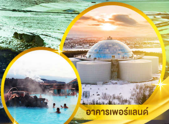
อาคารเทอร์โมแลนด์