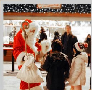
“ODORI GERMAN MARKET”