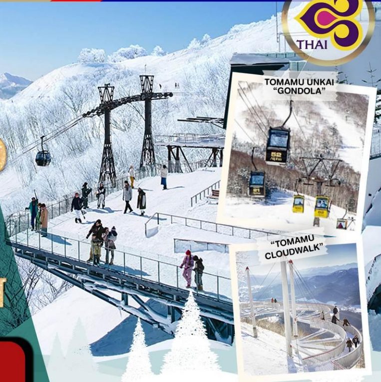
TOMAMU UNKAI "GONDOLA"