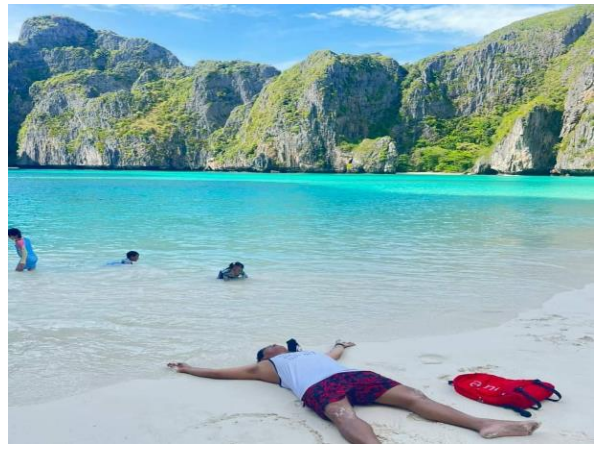
จากนั้นนำท่านไปชม อ่าวปิละ ถ่ายภาพกับความงามของลากูน