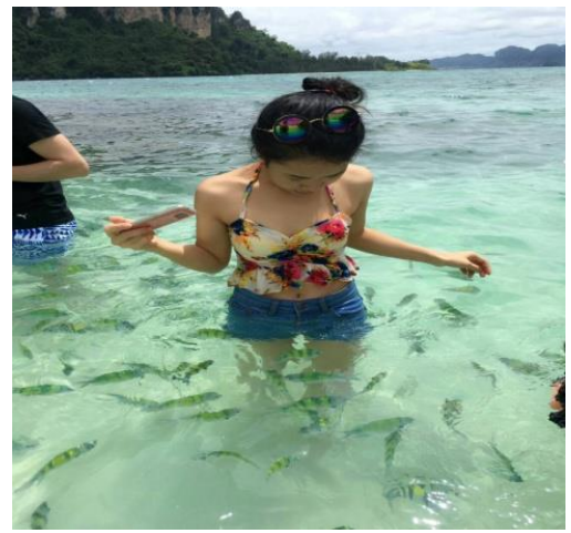
ชมทะเลแหวกUnseen in Thailand เชื่อมระหว่างเกาะทับ และเกาะหม้อ