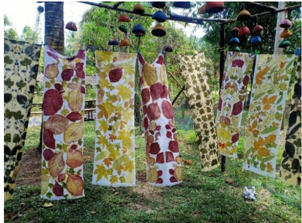
จากนั้น แวะชมศูนย์หัตถกรรมกลุ่มกะลามะพร้าว ผลิตภัณฑ์จากกะลามะพร้าว