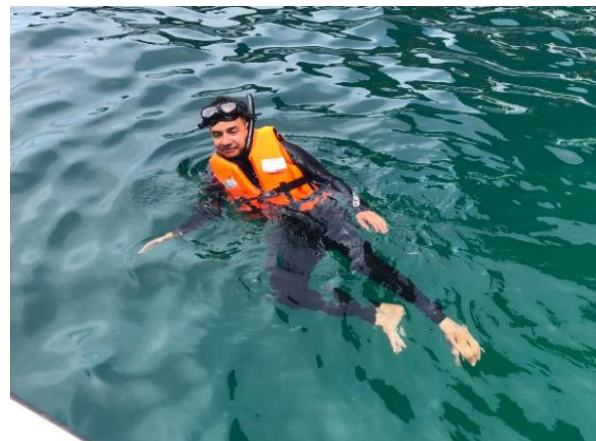
ออกเดินทางไปยังเกาะพีพีดอน