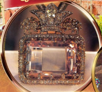
NATIONAL JEWELRY MUSEUM