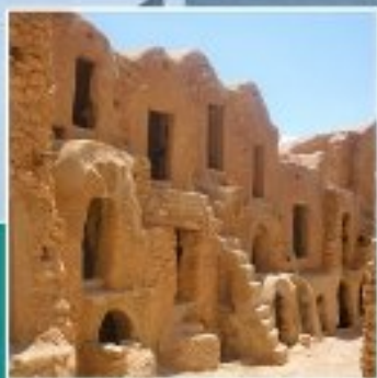
KSAR EL FARCH