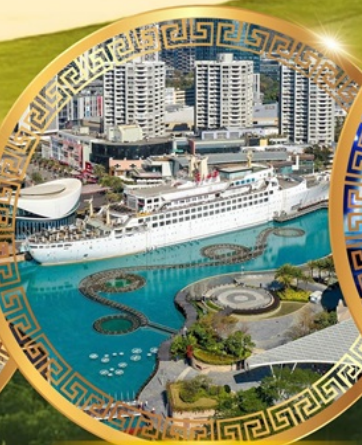
ท่าเรือ Sea World