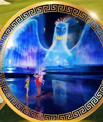
การแสดงม่านน้ำ