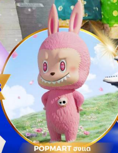
POP MART ฮงแด