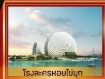
โรงละครหอยไข่มุก