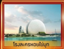
โรงละครหอยไข่มุก