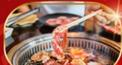
บุฟเฟ่ต์ปิ้งย่าง ไม่อั้น

KOREAN AIR บริการอาหารร้อน peach เอนเตอร์เทนเมนท์ฟรี