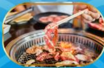
บุฟเฟ่ต์ ยากูนิกุ