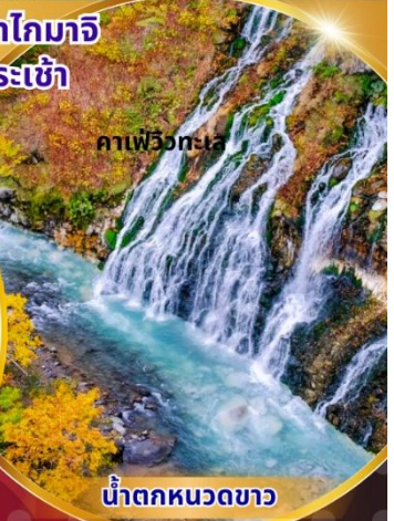
คาเฟว็องเต