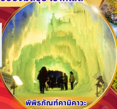
พิพิธภัณฑ์คามิคาวะ